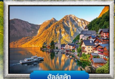
อัลสส์ตัก