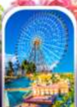
เมืองเฟรนด์ชิป