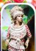
หมู่บ้านชมผ้า