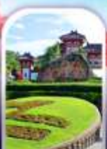
อุทยานหนานชาน