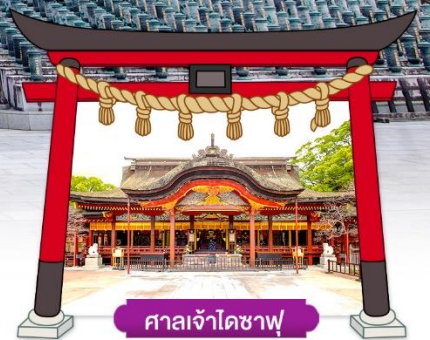
ศาลเจ้าโดซาฟุ