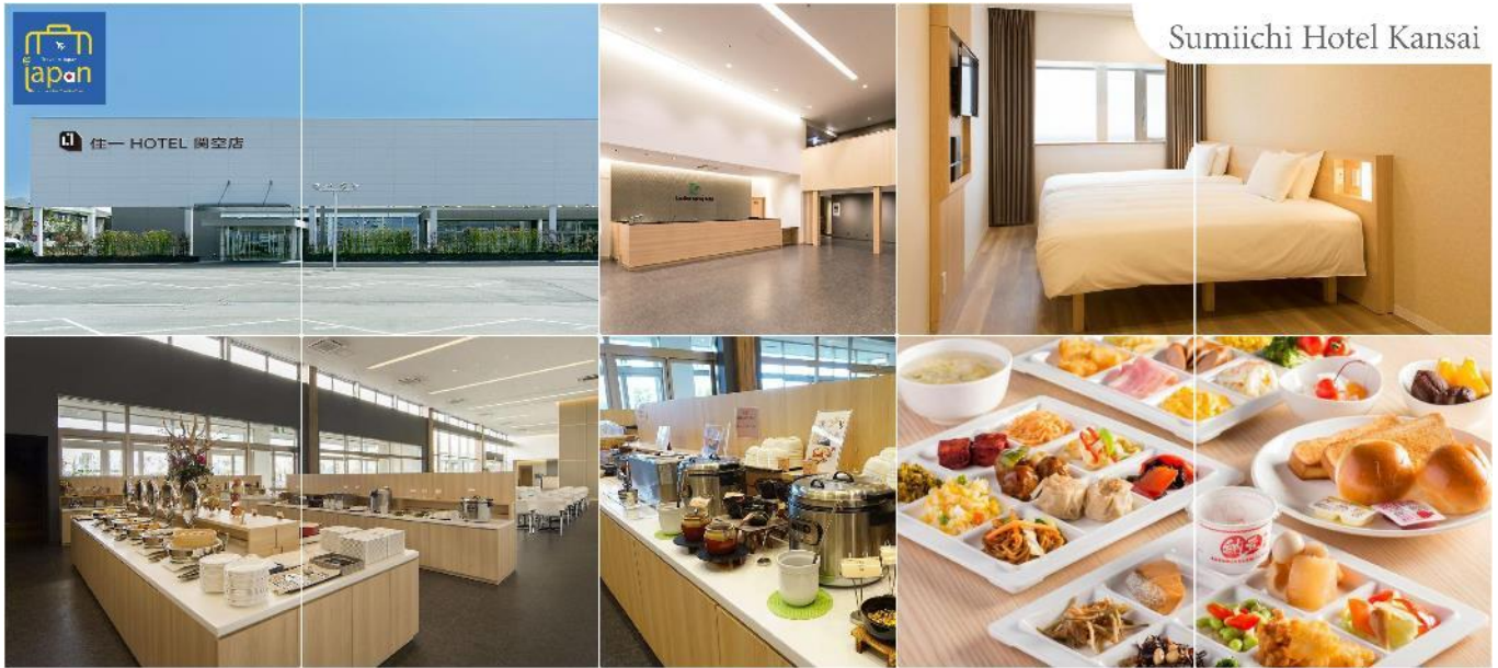
Sumiichi Hotel Kansai

ได้เวลาอันสมควรนำท่านสู่โรงแรม (ใช้เวลาเดินทางประมาณ 50 นาที)