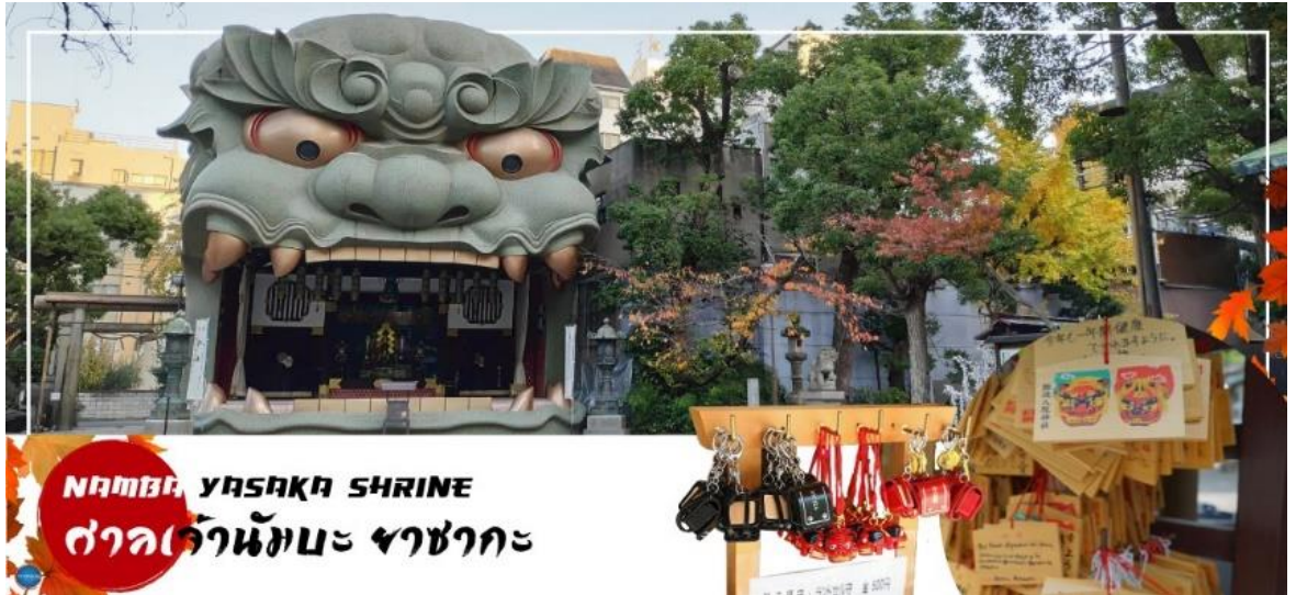
นัมบะ YASAKA SHRINE